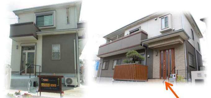
外観 ※ごぶごぶの入り口は写真右側の玄関です

「ごぶごぶ」という愛称には、支援する側される側のような枠をつくらず、“五分と五分”の関係を大切にしたいという思いを込めて名付けました。