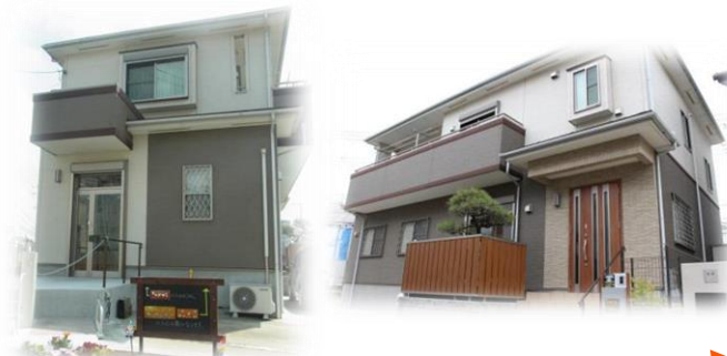
外観 ※ごぶごぶの入り口は写真右側の玄関です

「ごぶごぶ」という愛称には、支援する側される側のような枠をつくらず、“五分と五分”の関係を大切にしたいという思いを込めて名付けました。