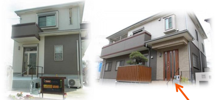
外観 ※ごぶごぶの入り口は写真右側の玄関です

「ごぶごぶ」という愛称には、支援する側される側のような枠をつくらず、“五分と五分”の関係を大切にしたいという思いを込めて名付けました。